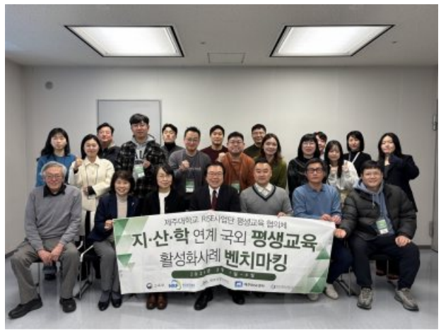
[ 방문 사진 ]