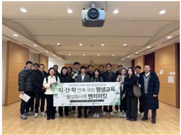
[ 방문 사진 ]