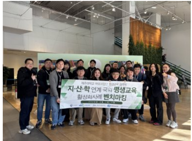
[ 방문 사진 ]