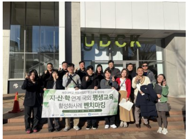
[ 방문 사진 ]